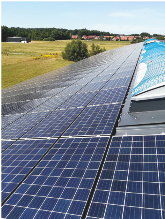
unten links: Photovoltaik-Anlage Emsbüren, Emsland oben rechts: Windpark Langwieden, Rheinland-Pfalz

In einem ersten Schritt hat sie zwei seit dem Jahr 2018 in Betrieb befindliche Photovoltaik-Anlagen im Emsland von der Prokon eG übernommen und betreibt sie weiter. Mit dem Betrieb der beiden Photovoltaik-Anlagen nimmt die Windauf eG selbst eine operative Geschäftstätigkeit auf.